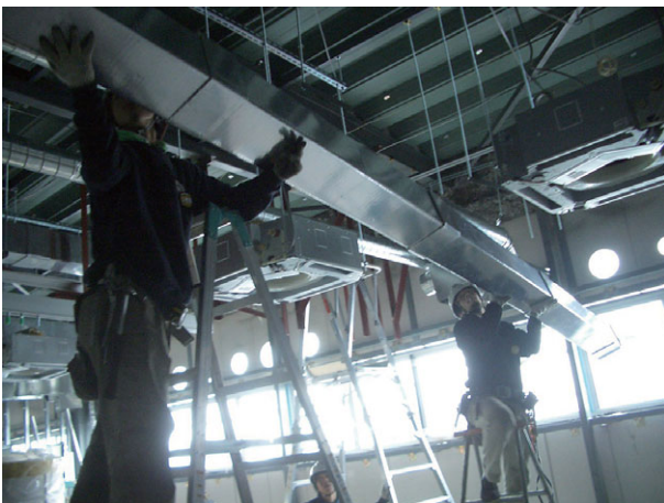
軽いので容易に作業できる