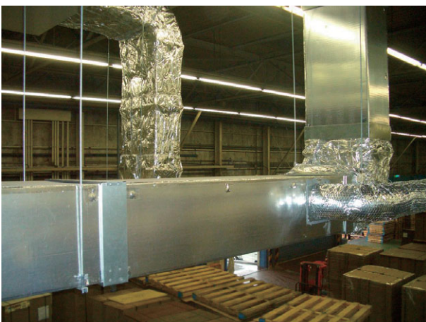
施工済みのダクト