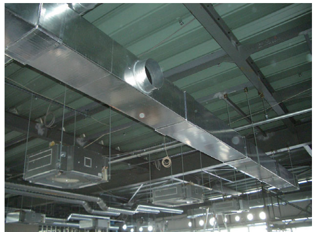
施工済みのダクト