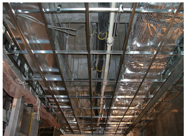
左がコルエアダクト 右が従来のダクト