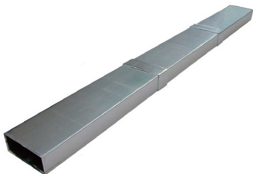
コルエアダクト外観