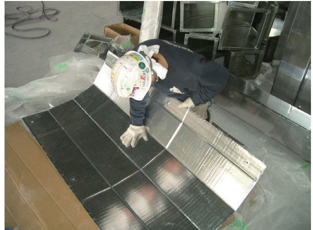
手で折り曲げて組み立てる