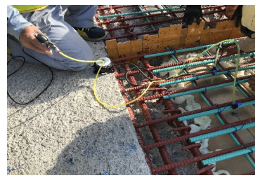
「円筒補修チューブ工法」

展示会に関する詳細は、ハイウェイテクノフェア 2023 特設サイトをご覧ください。