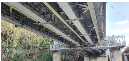
「主桁・床版一体型 FRP 検査路」